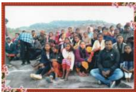
9. und 10. Klasse beim Schulpiknik