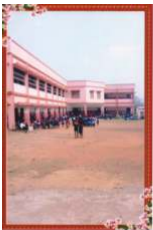
Der Schulhof in Bartua