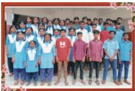
Die Schülerinnen und Schüler der 10. Klasse