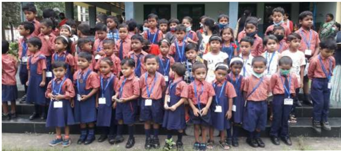
St. Michael Montessori School