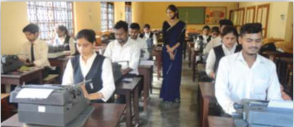
Die Ausstattung der Schule ist noch sehr „Analog“ bestückt!