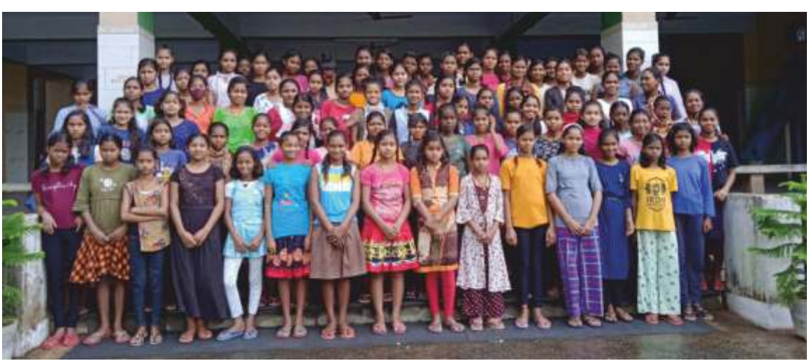
St. Roberts School - Hostal Schülerinnen