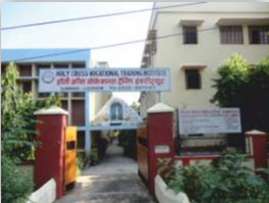
Das Berufsausbildungszentrum in Lucknow

Möge Gott uns in unseren Bemühungen segnen. Möge Gott auch Sie und Ihre Familien segnen. Lassen Sie uns gemeinsam unsere Jugend, insbesondere die Mädchen und Frauen, ausbilden.