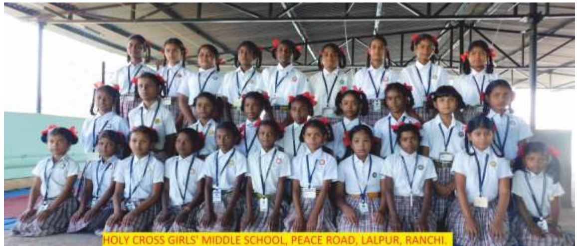
HOLY CROSS GIRLS' MIDDLE SCHOOL, PEACE ROAD, LALPUR, RANCHI.