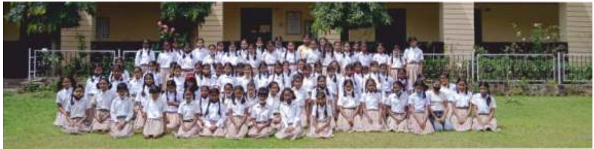
St. Roberts School - Middle School